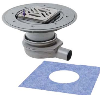
Illustrazione mostra Cod. art. 44 700.53 con sistema di bloccaggio Lock & Lift

Griglia Design Kessel 120 × 120 mm (Classe antiscivolo R9 a norma DIN 51130, Classe antiscivolo C a norma DIN 51097) e cornice in acciaio inox V2A (altezza cornice: 10 - 23 mm), classe L 15