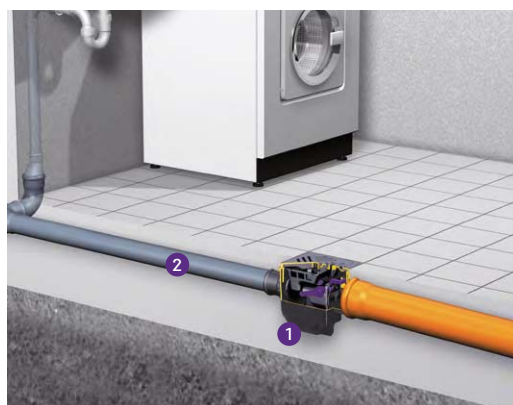
1 Scarico 2 Entrata

Drehfix è uno scarico per cantine con protezione antiriflusso rimovibile integrata (tipo 5). Inoltre, protegge i punti di scarico collegati quali i lavabi, le docce o le lavatrici dalle acque di scarico provenienti dalle fognature. Con chiusura antidiodore, cestello di raccolta fanghi, chiusura di emergenza bloccata manualmente e una capacità di scarico di 1,8 l/s, è utilizzabile in modo flessibile ed è così compatto che trova posto nelle nicchie dei vecchi scarichi di ghisa. Pertanto, è perfetto per i progetti di restauro.