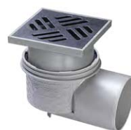
Illustrazione mostra Cod. art. 45 110.40 (scarico laterale)